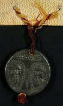
Bolla di Innocenzo IV per l'approvazione di otto canonici