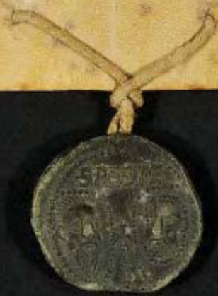
Nicolò IV commette al vescovo la decisione su di una controversia